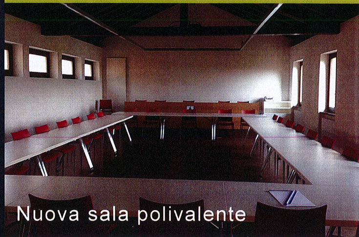
Nuova sala polivalente

È autorizzato un ammortamento straordinario di fr. 518'329.45 a carico dell'esercizio 2012 del Comune.