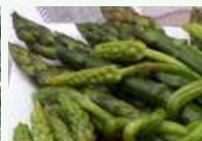
Scarti organici di cucina vegetali cotti