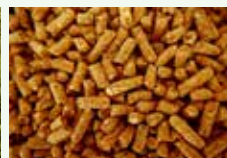
Lettiere vegetali di piccoli animali non carnivori